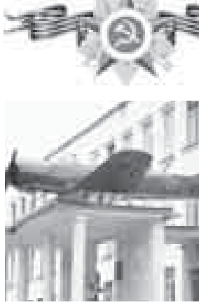
В 2017 году в школу №19 носящую имя Героя Советского Союза Алим Байсултанова, вернулась отставная авиагруппа истребителей «Ля-5» времён Великой Отечественной войны. Многие думают, что на козлырке учебного заведения стоит макет. Однако это настоящий истребитель времён Великой Отечественной войны, подаренный школе основателем авиагруппы в 1987 году. Точно на такой же машине воевал Алим Байсултанов. К памяти героя в школе относятся с большим уважением. Здесь работает музей его имени, экспозиция которого дополняется документами, фотоматериалами и книгами, рассказывающими о его жизни и подвиге. Алим Байсултанов родил

ся 15 мая 1919 года в селе Ныкийи ныне Чегемского района Кабардино-Балкарии в многодетной крестьянской семье. В 1937 году окончил педагогическое училище и Нальчикский аэроклуб. В армии с 1937 года. В 1939 году окончил Ейское военно-морское авиационное училище. Служил в строевых частях авиации ВМФ на Балтийском флоте. В составе 13-го истребительного авиационного полка защищал небо Таллинна, сражался над полуостровом Ханко, с воздуха защищал «дорогу жизни» в блокадный Ленинград. Гвардии капитан Алим Байсултанов, заместитель командира эскадрильи 4-го гвардейского истребительного авиационного полка (61-й истребительная авиационная