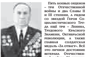
Несмотря на солидный возраст, он в курсе всех политических событий как в стране, так и на международной арене, имеет собственное мнение о дне сегодняшнем, людях, нравах, которые, по его глубокому убеждению, постепенно утрачивают стержневые основы, «позволяющие человеку становиться». Этим, на первый взгляд, странными словами ветеран выразил своё мировоззрение о смысле жизни, говоря, что человеку становится, и это многотрудная объёмная работа, в которой люди учают быть частью всеобщей единой человеческой души, представителем которой является второе лицо — «не я».

Если вы можете признать чуждое интересам своим, значит, поделитесь тем, что имеете порошу с другим, — говорит он. — А тогда, когда сумеете признать чуждое интересам выше собственных, например, отдаёте безвозмездно своё место в очереди за жизненно необходимым, тогда действительно станете настоящим человеком, который уже состоялся. Для этого нужно себя превозмочь, став частью великого события, имея к этому — человечество в целом, во всем разнообразии лиц, имен, вероисповеданий и времени обитания на земле.