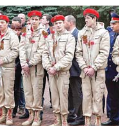
М. ЯРОСЛАВСКАЯ.

В 11 часов от площади 400-летия единения народов России и Кабардино-Балкарии началось шествие участников всероссийской акции «Бессмертный полк».