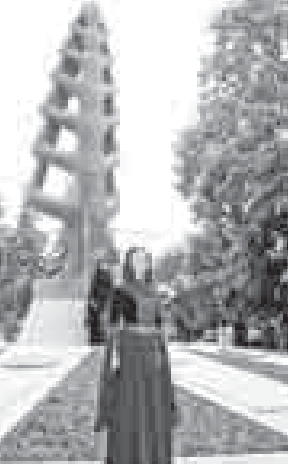
Участники митинга возложили цветы к подножию Древа жизни.

Никогда и никому не удалось остановить бег времени