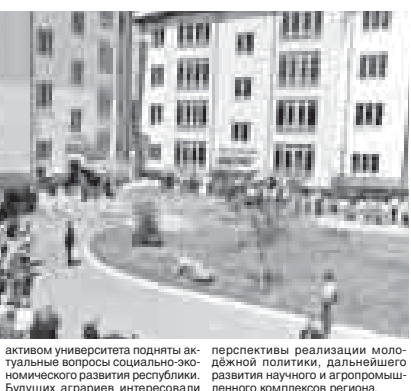
М. ЯРОСЛАВСКАЯ.

ского обучения специалистов широкого сельскохозяйственного профиля». В ходе встречи со студенческим активом университета подняты актуальные вопросы социально-экономического развития республики. Будущим аграриев интересовали перспективы реализации молодежной политики, дальнейшего развития научного и агропромышленного комплексов региона.