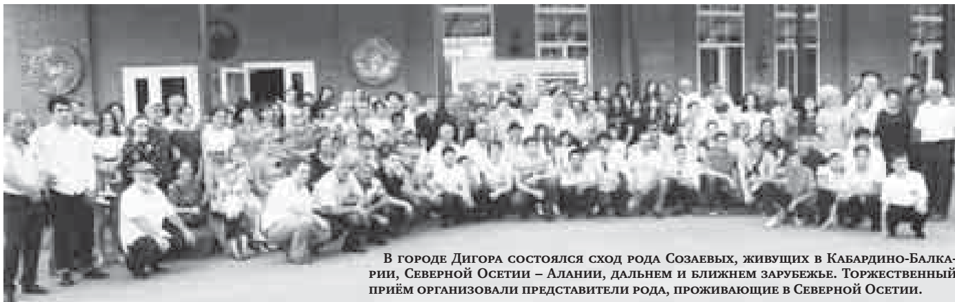
В городе Дигора состоялся сход рода Созаевых, живущих в Кабардино-Балкарии, Северной Осетии – Алании, дальнем и ближнем зарубежье. Торжественный приём организовали представители рода, проживающие в Северной Осетии.

Целями схода были дальнейшее укрепление братских связей, обеспечение преемственности поколений, желание развития и поддержания интереса у молодёжи к истории и будням рода.