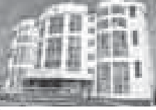
Изображение здания Росреестра.

Деятельность Росреестра по созданию и развитию кадрового потенциала соответствует государственной политике в вопросах подготовки руководителей нового поколения. В частности, в начале 2018 года состоялся финал конкурса «Лидеры России». Работе с кадрами уделяется особое внимание и в Минкомразвития России. В 2017 году был проведен конкурс «Лидеры Мизанка». Из 75 финалистов этого конкурса 23 являются сотрудниками Росреестра, 15 представителей ведомства вошли в число его победителей. Финалисты конкурса представили проекты, направленные на развитие сферы недвижимости и земельно-имущественных отношений. Кроме того, в Росреестре применяется системный подход в вопросах