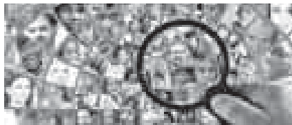
График, иллюстрирующий процесс проведения переписи населения.

На первом этапе пробной переписи (с 1 по 10 октября) любой житель России, имеющий подтвержденную учетную запись на портале госуслуг,