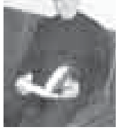
(литературоведческие) посвящены творчеству писателя...