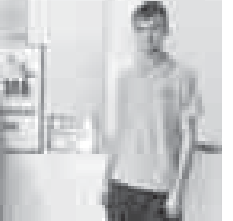
иллюстрационная выставка, на которой предстали литературо-му, как стать лучше, о культуре поведения, этикетке, статьи о подвигах наших соотечественников...