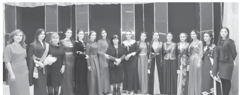
Участницы и члены жюри республиканского конкурса «Адыгэ пщазэ-2014»

тельных видов искусства, традиционного национального костюма – черкески, а также хореографии и песнопения. Учреждает и издаёт печатные и электронные СМИ, вы-