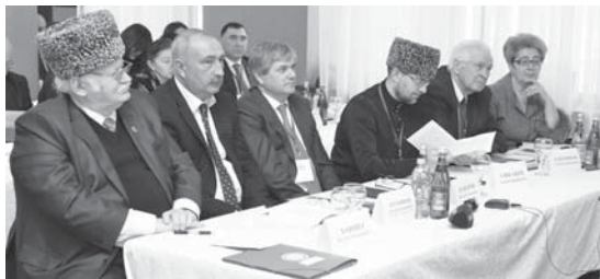
На международной научно-практической конференции МЧА 2017 г.