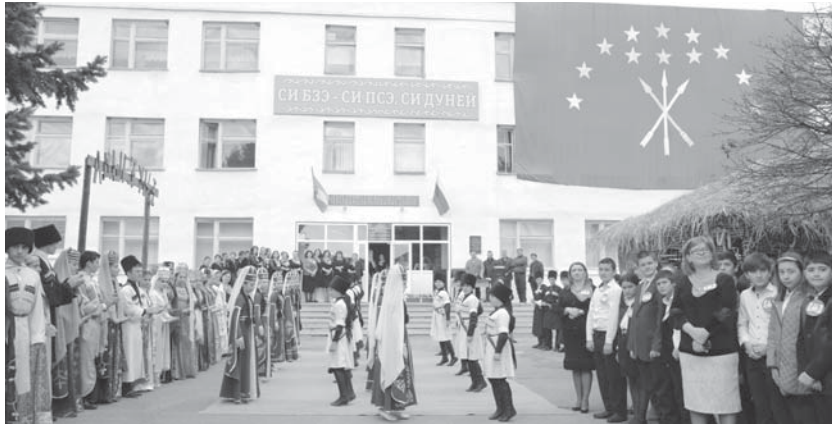
Участники конкурса-фестиваля «Си бзэ – си псэ, си дуней» встречают гостей – членов жюри, с. Лескен II, 2014 г.