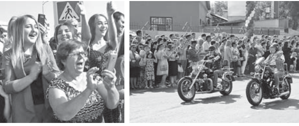
Юрий Ковков открывает движение по новой трассе.

В завершение Юрий Ковков поздравил награжденных с высокими государственными отличиями, пожелав новых свершений, счастья, благополучия и выразил уверенность в том, что республика, обладающая такими ценными кадрами, по-прежнему, имеет все возможности для дальнейшего успешного развития. Распоряжением Президента Российской Федерации за заслуги в научной деятельности и многолетнюю добросовестную работу Главы Кабардино-Балкарской Республики награждаются: «За заслуги перед Кабардино-Балкарской Республикой» награждаются: