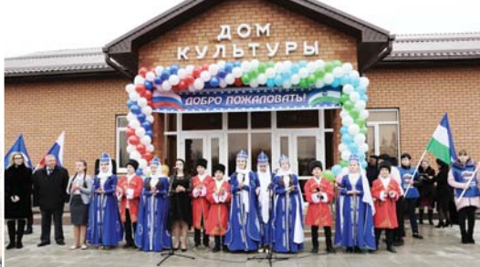
Подготовили Ирина БОГАЧЕВА, Марияна БЕЛГОРКОВА, Вероника ВАСИНА

Построено 11 домов культуры в сёлах Красносельское, Ероково, Мушто-Сырт, Хамиде, Зарагж, Кичмапка, х. Кол-Даринское, с. Жанхотек, Пашукта, Псынадаха.