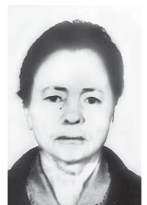
Материалы рубрики подготовила Ирэна ШКЕЖЕВА

Если вы обладаете какой-либо информацией, способствующей установлению её местонахождения, просьба сообщить по телефону: 8(86631) 7-58-02, 7-67-02, 02 или обратиться в ближайшее отделение полиции.