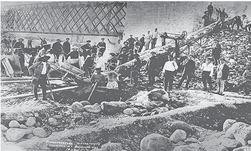
Строительство моста через реку Нальчик к селению Вольный Аул. 1933 г.