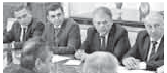
Врио Главы КБР К.В. Коков провёл рабочее совещание с руководителями муниципальных образований республики. В числе первоочередных задач названы повышение доходов, уровня занятости и социальной защиты населения, улучшение жилищных условий граждан, тесное взаимодействие с общественными организациями, институтами гражданского общества в целом.

ВРИО ГЛАВЫ КБР ПРОВЁЛ РАБОЧЕЕ СОВЕЩАНИЕ С РУКОВОДИТЕЛЯМИ МУНИЦИПАЛЬНЫХ ОБРАЗОВАНИЙ РЕСПУБЛИКИ