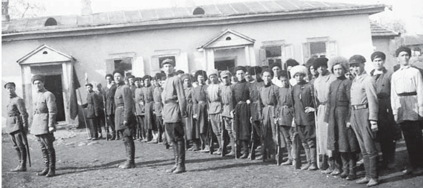
Допризывники-националы на Урванском учебном пункте, Старый Черек, 1926 г.

1 октября начался осенний призыв на срочную службу – с этого дня и до конца призыва в военных комиссариатах работают медицинские комиссии, определяется пригодность молодых людей к службе, ребят отправляют в воинские части. Осенний призыв будет завершён 30 декабря, в воинские формирования по всей стране отправятся 400 молодых людей из Кабардино-Балкарии.