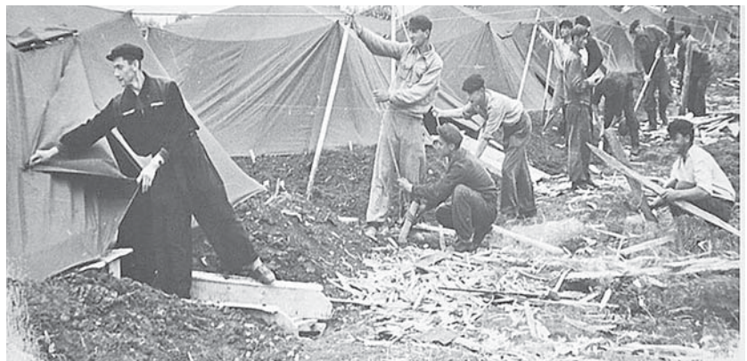
Строительство комбината «Искож»

1963 г. – образование Нальчикского текстильно-трикотажного комбината «Дружба» на базе