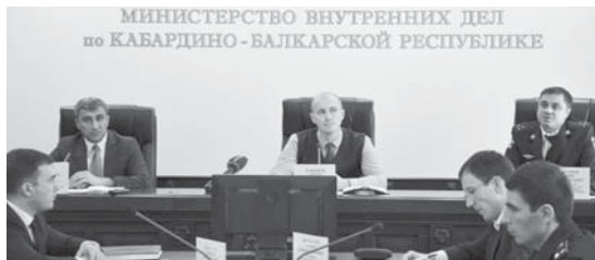
МИНИСТЕРСТВО ВНУТРЕННИХ ДЕЛ по КАБАРДИНО-БАЛКАРСКОЙ РЕСПУБЛИКЕ

В МВД по КБР впервые прошла «прямая линия» по вопросам профилактики и противодействия коррупции в рамках реализации Национального плана противодействия коррупции.