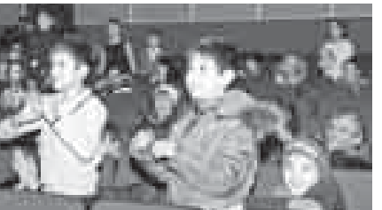
оказанного героя из мультфильма «Щенячий патруль», которого встретили дружно, возгласами радости и аплодисментами.

В Государственном киноконцертном зале прошёл праздничный концерт, посвящённый Международному дню инвалидов. На него пригласили 120 детей с ограниченными возможностями здоровья. Организатором выступил центр труда, занятости и социальной защиты г. О. Нальчик.