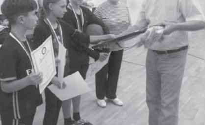
Ряд мероприятий Совета женщин г.о. Нальчик был посвящён Дню матери и Дню семьи в последнее воскресенье ноября

В спортивном комплексе «Кристалл» были организованы спортивные состязания с участием детей разных возрастных групп, в том числе — из малообеспеченных семей.