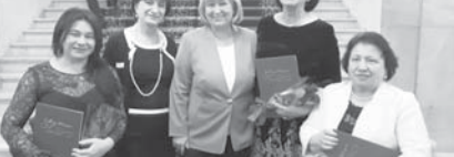
В начале 2018 года в общественную организацию пришло письмо от организаторов федерального информационного проекта «Мир женщин», который реализуется общественной организацией «Союз женщин г.о. Нальчик».

Союз грантодающих организаций России «Форум доноров», который при содействии Министерства экономического развития РФ и Фонда президентских грантов поддерживает проекты, направленные на формирование демократического гражданского общества в России, провёл IX конкурс добровольцев публичных годовых отчетов некоммерческих организаций.