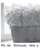
Их не больше, чем в тех, кто осенью перекапывает весь огород.