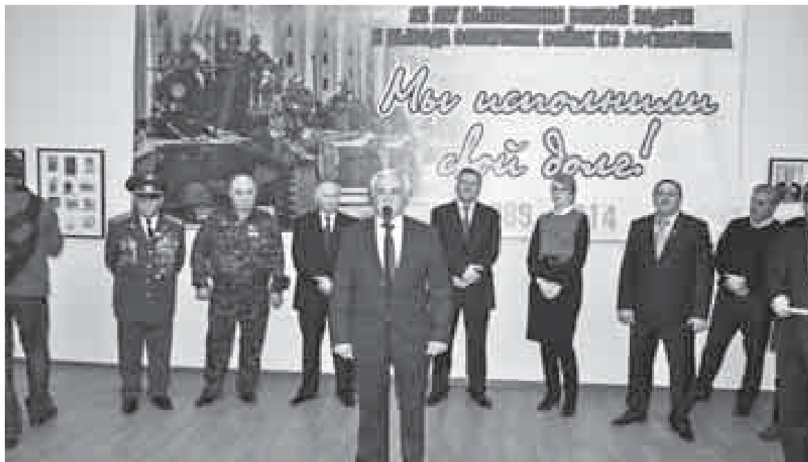
Совет аскер Афганистандан чыккыгъанлы 25 жыл толгъанына аталгъан кёрмючню ачылыуунда.

шүёху бар эди! Акъ «Волгасында» ол бизге, биз сунмай тургъанлай, келип къалыр эди да, эригиулю жашауубузну олсагъат жарытыр эди. Ол энди Москвада жашайды, кёп болмай Къарачай-Черкес Республиканы битеу газетлеринде Ачахматны, уллу дипломатны юсюнденча, очерк жазылгъанды. Аны окъуй туруп, бизни афган жерде тюбешиулерибиз кёз аллыма келе эдиле.