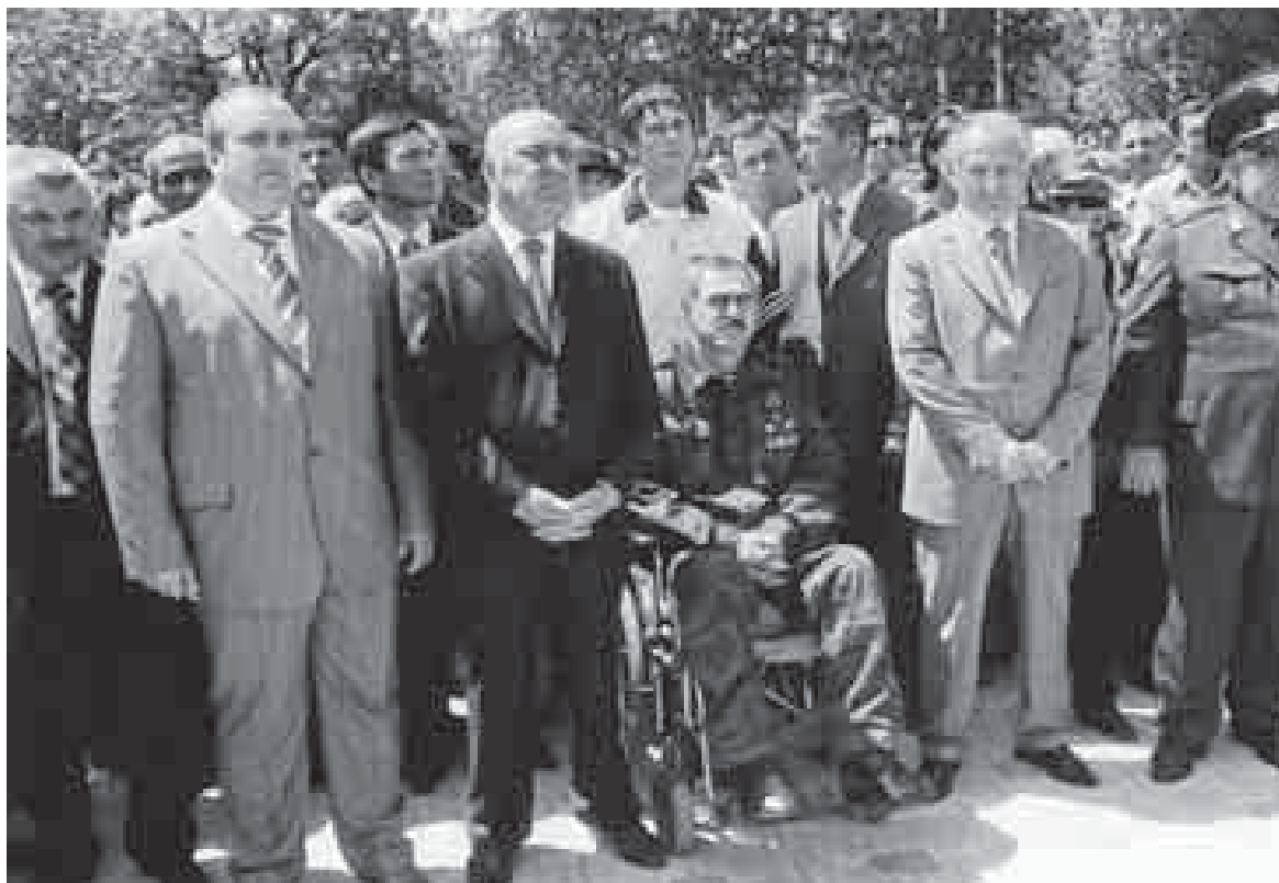
Афганистанда ёлгенлеге аталган эсгертмени ачылыуунда

наннгандыла эмда «дуст шуравилеге» (совет шуёхлагъа) иги кёзден къарагъанларын жашырмагъандыла.