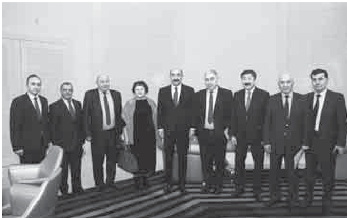
Азербайджанны культура министри Адилфас Караевда