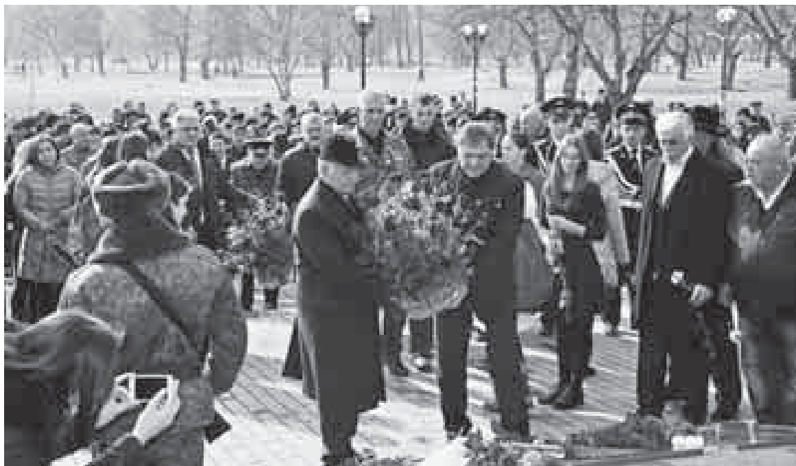
Афганистанда жоюлган аскерчилени эсгертмесине гюлле салыу. Нальчик, 2014 ж.