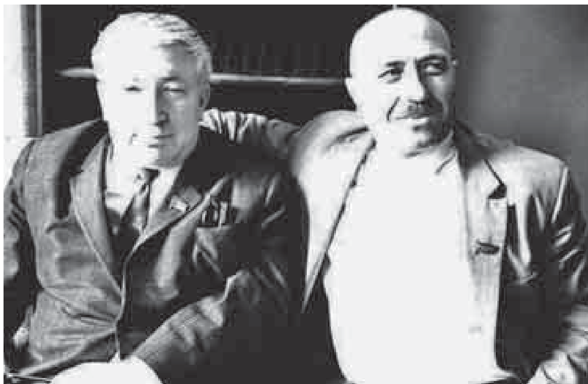
Расул Гамзатов бла Къулийланы Къайсын. Махачкъала, 13.05.1970 ж.