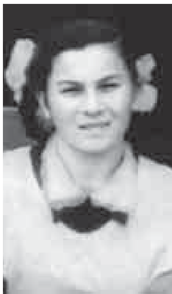
Шамканы школ заманы