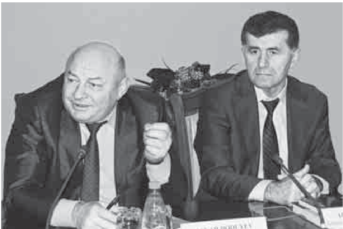
Додулары Аскер бла Атабийлары Алий.