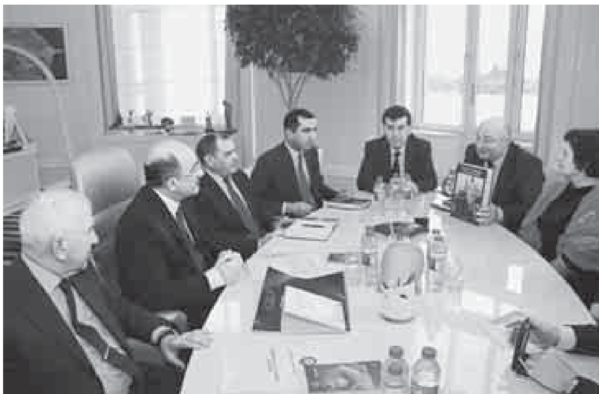
Министрни кабинетинде. Кенгеш.