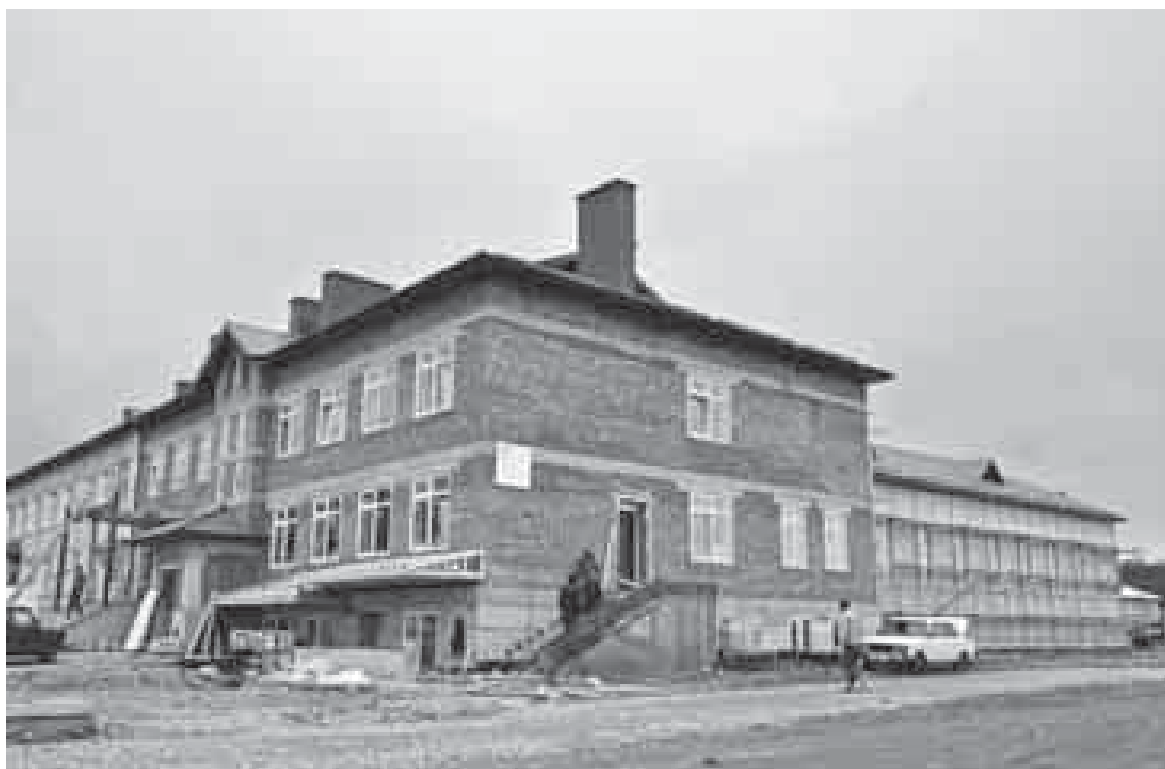
Ташлы-Таланы ишлене тургъан школу