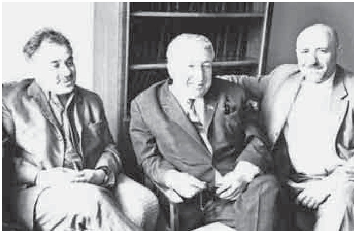
Наум Гребнев, Расул Гамзатов, Къулийланы Къайсын. Махачкъала, 13.05.1970 ж.