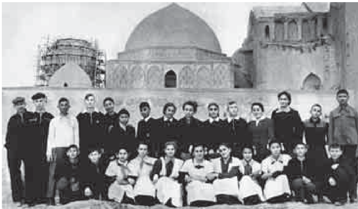
5-чи класс, озган ёмюрню эллинчи жыллары. Туркестан шахар