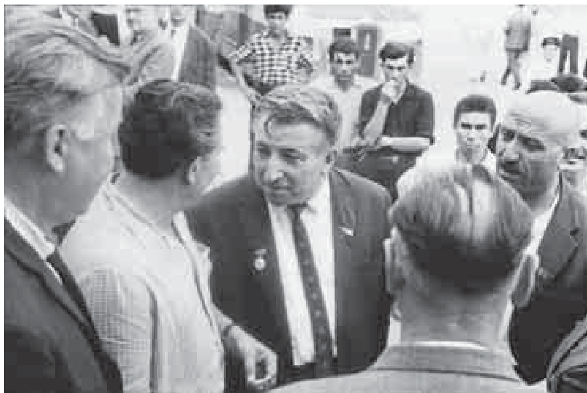
Къулийланы Къайсын бла Александр Твардовский. Махачкъала, 1963 ж.