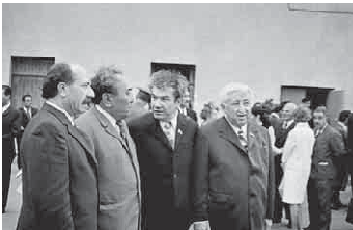
Къулийланы Къайсын, Давид Кугультинов, Мустай Карим, Расул Гамзатов. Махачкъала, 1973 ж.