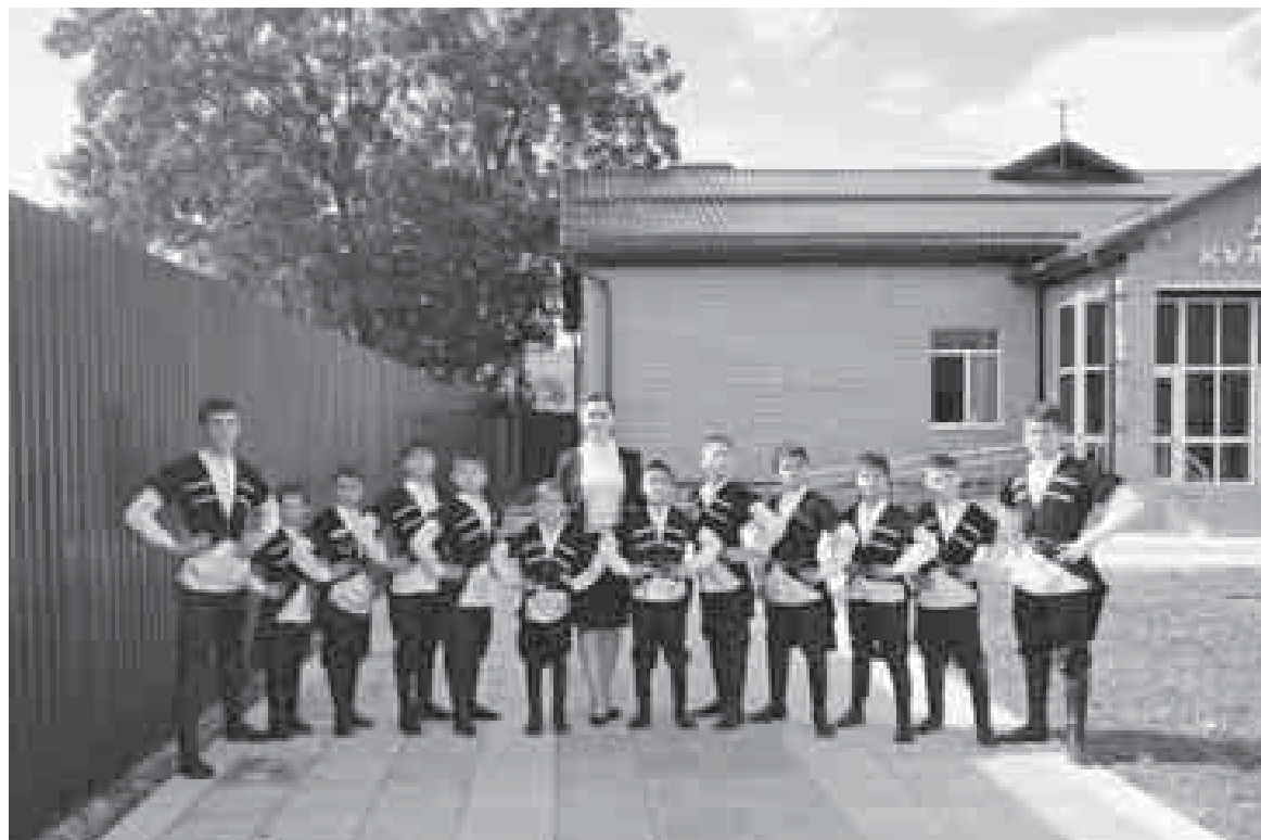
Школну директору Цаколаны Жамиля бла окъуучулары тепсеу къаууму

121 сабий, эки къауумгъа бѐлюнюп, эки сменни окъуйдула, шѐндюгю «школларыны» тарлыгъына тарыкъгъан жокъду. Былагъа билим берген 20 устаз бусагъатдагъы окъуу юйню арбазында кенгеш бардырып, дерслерине алай кирдиле.