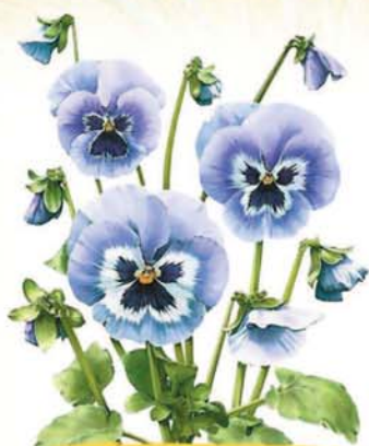
Жэщудэ Ночная фиалка