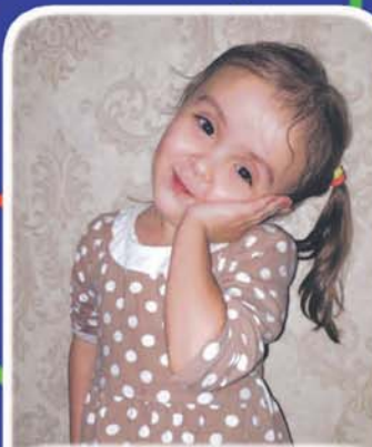
Емкъуж Лилианэ сабий сад «Улыбка», ильэсиплі, Налшык къ.