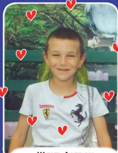
Шакъ Аслъэн МОУ СОШ № 2, ильэсибгъу, Къэхъун къу.