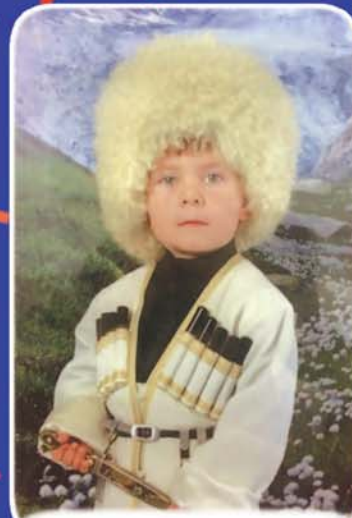
Хъэмгъуэкъу Дамир сабий сад № 2 «Золушка» Нарткъалэ