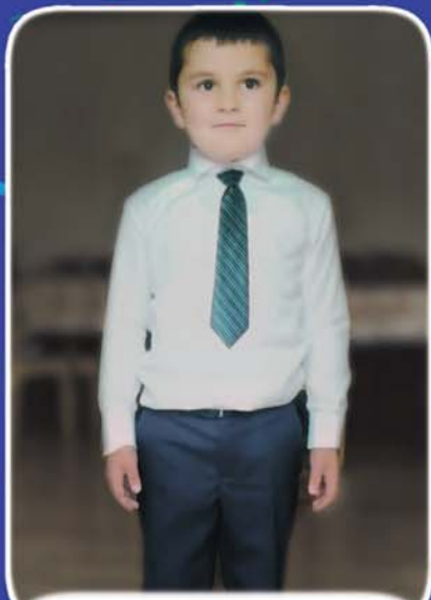
Щомахуэ Алим СОШ № 2, 2 «б» кл., Зэйкъуэ къу.