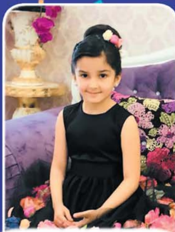
Кіэрэф Айлэ гимназие № 14, 3 «в» кл., Налшык къ.