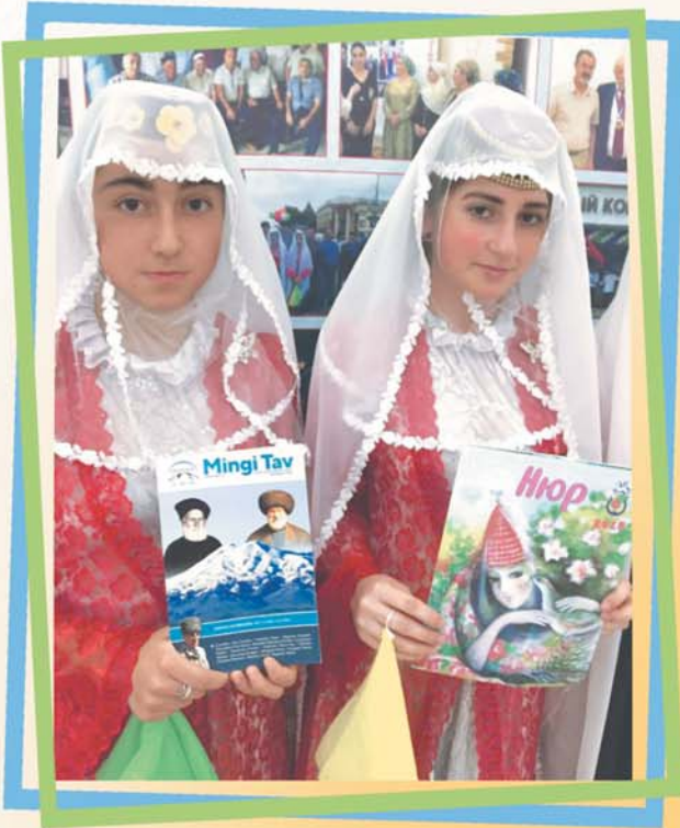
Бизни «Минги-Тау», «Нюр» журналларыбыз бла сауғаланган тюркю къызчыкъла