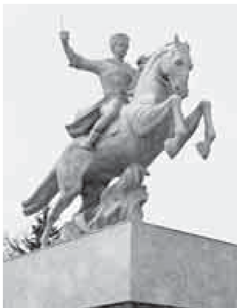
115-нэ шуудзэм хэту Хэку зауэшхуэм хэкIуэдахэм я фэепль.

И лэжьыгьэхэм кыыхахри, Шэджем укьыщикIкIэ, Налшык кьыдэлгьэдапIэм деж, 2005 гьэм цагьэуващ 115-нэ шуудзэм хэту Хэку зауэшхуэм хэкIуэдахэм я фэепль скульптурэр. Абы кыкIэлгьыкIуащ Хьэтиохьушокьуэм и хадэм и ихьэпIэм деж щыт Кьалмыкь БетIал, ЩоджэнцIыкIу Алий и цIэр зезыхьэ Кьэбэрдей кьэрал драмэ театрым и гупэм щыт ЩоджэнцIыкIу Алий, Профсоюзхэм культурэмкIэ я унэм и утыкум и бгьум цагьэува Кулиев Кьайсын, кьалэ администрацэм и гупэм кьит Кьышчокьуэ Алим сымэ я скульптурэ фэепльхэр. КьищынэмышIауэ, Аргудан, Зэрэгьыж, Псыгуэнсу, Шэджем ЕтIуанэ, нэгьуэщI кьуажэ куэдми дэтщ Хэку зауэшхуэм хэкIуэдахэм яхуищIа фэепльхэр. ТхьэкIумашэ