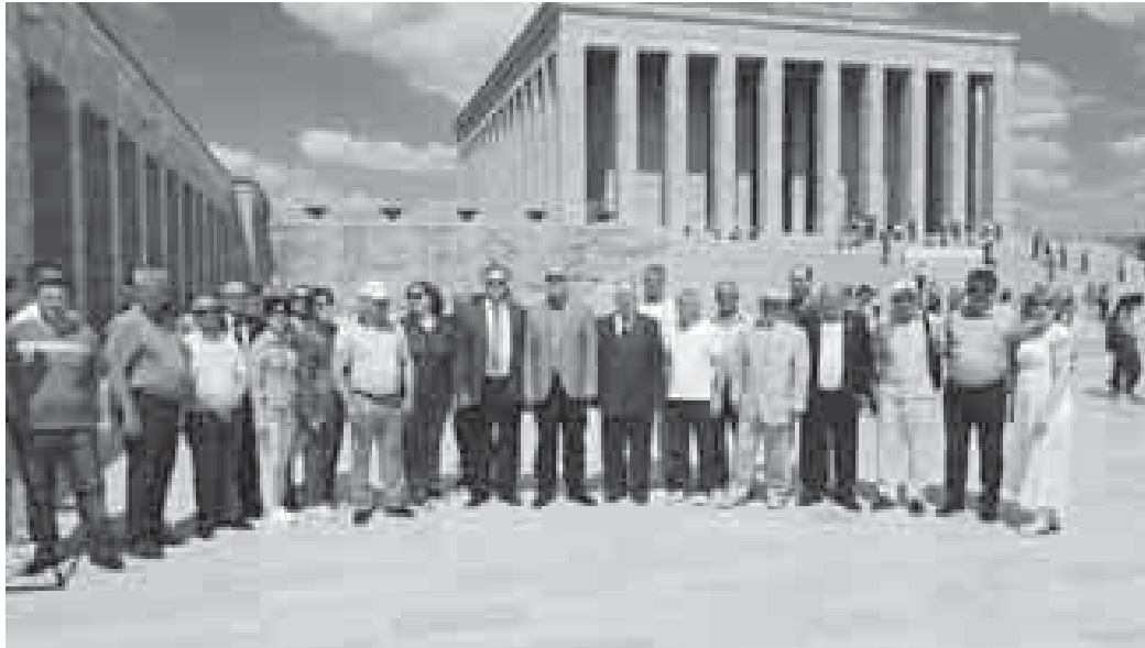
Хасащхьэм хэтхэр Ататюрк и мавзолейм и щІантІэм дэтщ.

Хасащхьэм хэтхэр зэхыхьэм ипэ кьихуэ махуэм щыІащ Тырку Республикэм и кьызэгьэпэщакІуэ, абы и япэ президент Мустафа Кемаль (Ататюрк) и мавзолейм икІи протоколым тету, ДАХ-м и тхьэ-