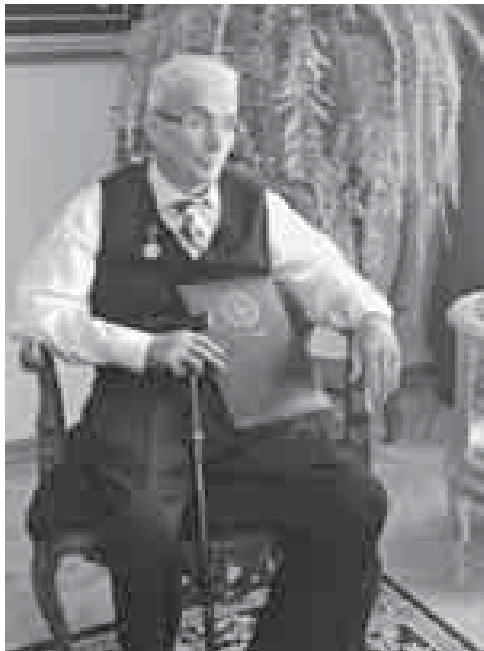
КАФФЕД-м и кьызэгъәпәшакIуэ-хэм ящыщ Хьәткьуэ Аслъән.

«Аныткабир» мавзолейм апхуэдэ IуэхукIэ ирагъэблагъэр кьэрал лIыщхьэхэмрә махуэшхуэ пыхыкIахэм хэтхэмрәщ. Тыркум ис лъэпкь-хэм бжыгьэкIэ ещанәу кьалыгтэ адыгэхәми щIэшхуэ кьыхуащIащ, Дунейпсо Адыгэ Хасэм кьыбгьэдәкI лIыкIуэ гупым апхуэдэ Iэмал кьратри. Гупым музейм зыщапльыхьащ, Ататюрк езым кьыгьэсәбәпа хьәпшыпхэр, кьыхуащIа тыгьэхэр, и гьащIэр кьызэрәкIуэкIам, и уна-гъуэ сурәтхэм, нэгъуэщI куэдми кьахутепсәлгьыхьащ.