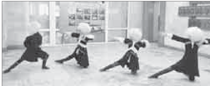
Фото и видео в Instagram аэтора.