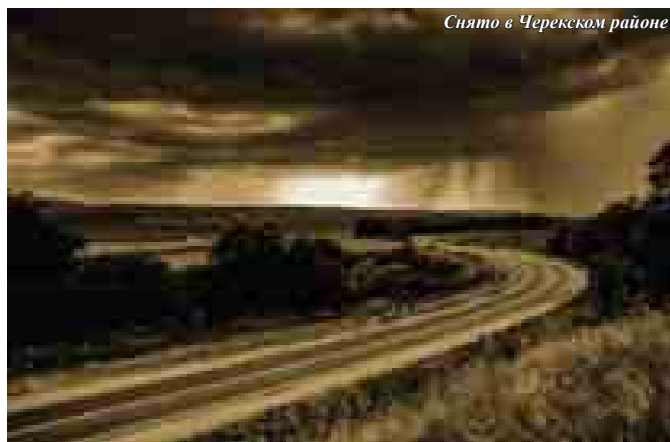
Снято в Черекском районе

А.Б.: «Снято в Долинске – отражение канатной в озере. Тросты как нотный стан, и кресла – ноты».