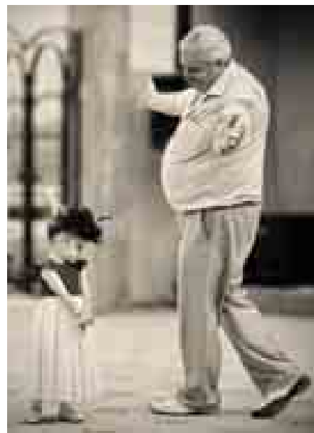
«ИЗВИНИТЕ, Я НЕ ТАНЦУЮ»

Мысли и настроение фотографа Байсиева ясно отражают и подписи ко многим снимкам, а в некоторых случаях подписи можно считать неотъемлемой их частью. Одна из таких – «Ноты души моей». Ни отнять, ни прибавить. Так же Ахмат хотел бы назвать свою персональную выставку, когда он наконец соберется ее устроить: «И будут в ней разделы: «Радость души моей», «Печаль души моей», «Надежда души моей»... Марина Карданова.