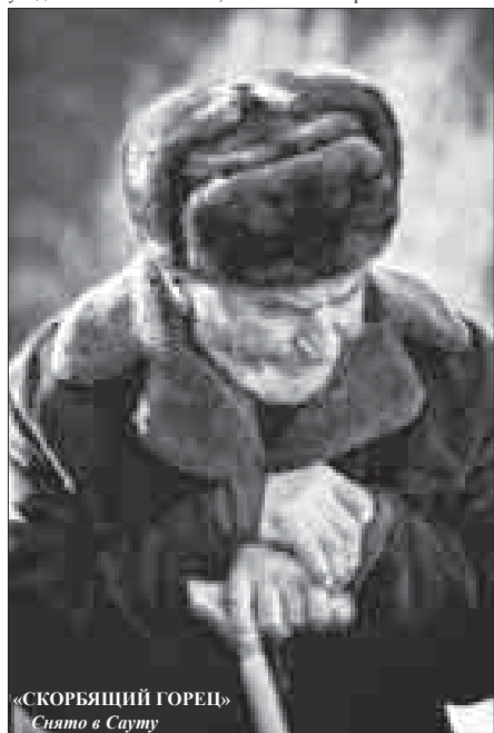
«СКОРБЯЩИЙ ГОРЕЦ» Снято в Сауту