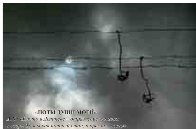
«НОТЫ ДУШИ МОЕЙ»

А.Б.: «Снято в Долинске – отражение канатной в озере. Тросты как нотный стан, и кресла – ноты».