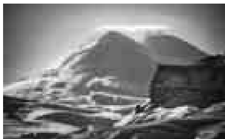
«ВЕЛИЧИЕ И ИЗЯЩЕСТВО»

Наверняка того же хотят и миллионы людей со смартфонами и селфи-палками. Я спрашиваю, возможно ли, что фото как искусство просто растворится, исчезнет. Ахмат не согласен: «Есть фото как картинка, а есть фото, которые трогают, вызывают эмоции. Скажем, те же горы, или грозное небо – ты смотришь и чувствуешь страх. Суметь передать состояние в фотографии – это и есть искусство. А красивую картинку – ее можно и в зеркале снять, симпатичная девушка с айфоном –