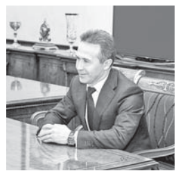
КъМР-ни Башчысыны бла Правительствоуно пресс-службасы.

Банк жумушланы жеңилдендирирге, льготалы кредитлени берюуге, ол санда жетип келген жаз башында санда ишлеге хазырланууда эм ала ны бардырууда аллай тюрюк кредитлени хайырланууга энчи эс бөлүнгенди.