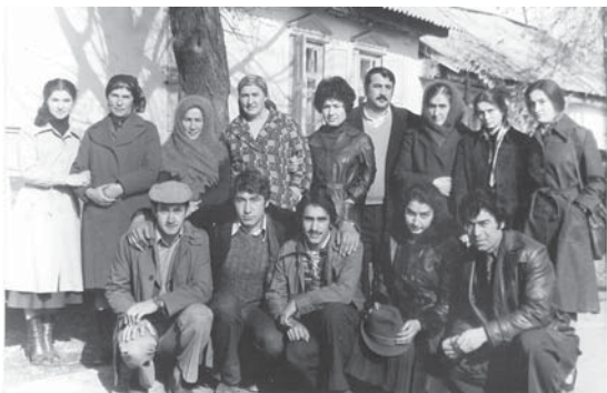
Локъман хажини кызылары, туудуклары.