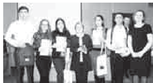
Хорлаганлагыла Табийгьатны битеудуния фондундан (WWF) саугьала, кыргалганыны барысына да ыразылыкть письмола берилгенди. УЛБАШЛАНЫ Мурат.

Алгаракчыла илмуну ыйгыныны чеклеринде Кыбарты-Малкьар кырал Аграр университетни агрономия бөлүмюнде республиканы табыгьаты бла байламлы конкур бардырылганды. Аны «ЭКОЛОГИЯ ЖИЗНЬ» жамауат организацианын тау тийрелени экологиясыны институтуну табыгьатын битеудуния фондуну (WWF)келечилери кырагандыла.