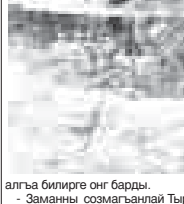
алга билдирге өң барды. - Заманы созмаганлай Тырныау шахарда ыркы суулануны бир жааны кетерген аркыкын тазалагыра, кесин да тиийиш халга келтиргери керекди. Бакса оюн сол жагында орналган объекттени саклачы аны жалгасын да кычирге тиийишиди. Чыранла төр эргиген кезинде ачыла да дайым көз-кыулак

Нальчикде Бийик таяу геофизика институту агилерини билдиргенерила, былга деп Экобус районда ыркы келир деп улуу кыоркыу барды. Ала айтханда көрө, шендоно амалланы хахыры бля аллай затны боллуугун он кюн