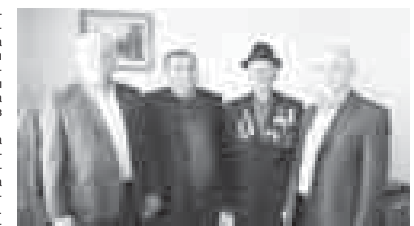
багылы сауугагы уа ол «КыМР-ни сыйлы нартох өсдорючюсо», «Сыйлы колхоз» деген атланы санайды.

Тогузаланы Аубекирини жашы Хусейни жашауу, көп таулу элинча, тынч болмаганды. Аны сорденине, тюрло-тюрло май-эмда көпчюнолжюк жырларна тошгенди. Тууган журтуна кыайтхандан сорая угьб жылланы механизатор болуп «Москва-колхозда» ишлегенди. Жигерлиги, арый-тала билмегени ючюн Урунууу Кызыл Байрагыны орденине, тюрло-тюрло май-даллагы, сыйлы грамоталагы да тиийиш болганды. Бек