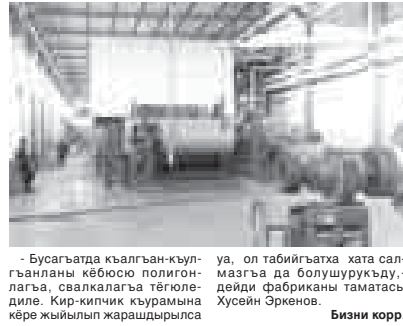
- Бусаггагда кыалган-кыуланланы кёбюсю полигонлагга, свалкалагга төгюленди. Кир-кичтик кыурамына керө жыйылып жарашдырыла

Уван районда картон чыгарган фабрикада кыайтарып хайырланыргга жарыган кыалган-кыуланланы жарашдырууну эки керө кёбейтирге белгиленеди, деп билдиределе районну администрациясыны пресс-службасындан. Асламысында мында макулатураны бла келечилген затланы хайырланадыла. Бюгонюкдө предприятие бир аны ичинде эки минг тонна кыагыт жарашдырыгга боллукду. Жуюук заманда аны 4,5 минг тоннагга жетдирит мурат барды. Дагында агаган-полимер композицияны жарашдыруу производство да анын барды. Аны хайырландан экологиягга да ахчы себеплик этилдикиди.