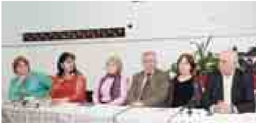
Окчуучулары поэти назмуларын малкыр эм орус тилде шакты айтханды. Милет кийимге кийген жашла бла кызыла уа кыонактылары аларында аяк бөгюдеди. Ахырында уа «Хасания элим» деген ат бла видеоролон көргөзүлгөндү.

Хасанияда хүнерликтери, фахмулары, ахшы ишлери бла аттары айтылганна, насыхла, кепдоле. Аланы хүрметлеу, ала бла тобушиуле кыруу мында төреге айланганды.