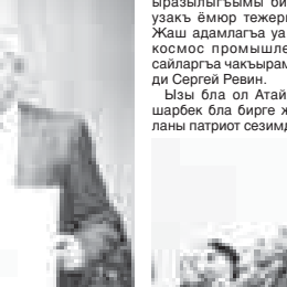
кыйын салгынлары ючюн юрөк ыразылыгын билдиргенди, саулык, эсенлик, узак ёмюр да тежгенди. - Бюгон жыйылуугга кыатышканыма бек ыразыма. Баргызында да байрам бла алгышлайыма. Кертисон айтканда, бизни усталыкда аскерчилик жаны бла жумуш кеп жорган, асламысында уруш баркын жерледе экология болумун тинтебиз. Адам улу бардырган кыауганды жер