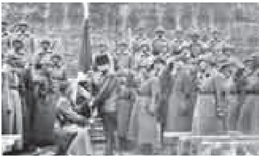
Алай бля 1918 жылда аскерде миллионга жуук адам бар эди - беш ай андан алты болгондон эки керете кел. 1920 жылда уа аскерине саны 5,5 миллионга жеткенди.

● Ал жылда профессионал аскерине жетишкенгенди. Аны юочон 18-40 жыллары толган эр кишини барысан да эсепте салып башагыландыла. Ол а Сауутланган кочлени тизинлерни кайбертиге онг бергенди.