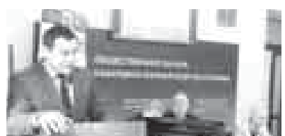
юйретуно бардырыуу, сора аланы кыауумундан кырал жарык жарыра катарланы казырлауу» – дегенди ол.