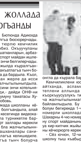
онгла да кырала бардыла. Кемчиликлени юслеринден айтканда, асламсы мектепелени аланда жоллада кыоркуусулук тийишлеси ча жалчытылымагыны бла байламлыдыла. Бу жаны бла болум бегирека 1-чи эм 7-чи номерли школгга осалды. Шахарны 4-чо номерли школуну спорт майданыны алпында уа кир-кичтик жыйыуу бакланы кечюрюрге керекди.