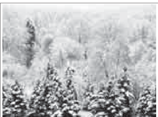
КъЫШ ЖАЗ БАШЫНА ЖОЛ БЕРИГЕ АШЫКЪМАЙДЫ. Сурат этюдну ХОЛАЛАНЫ Марзият олганды.