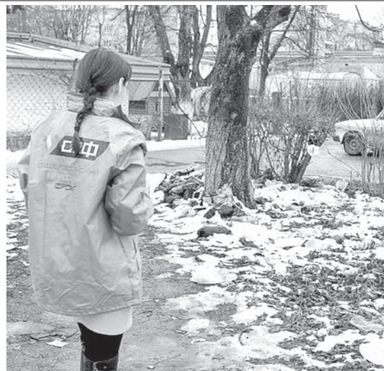
тебирерикдиле. Курорт жерлеге бла энчи сакъланган табийгъат тийрелеге аслам эс буруллукуду, - деп билдиреди Фёдорова.

тазаланганды. Республиканы жамауатыны кёбюсю санитар-эпидемиология болум бузулмау жанлыдыла. Ол себепден проектге болушлукь этерге сыйгенле да табыладыла. - Бусагъатда «Свалкаланы интерактив картасы» деген ачыкь сайт ишлейди. Аны магъанасы саулай да регионда экология болумну игилендириу бла байламлыды. Быйыл жамауат, министерствола, ведомствола да экология проектге бютюнда тири кьатышырла деп ышанабыз. Жаз башы келгени бла ОНФ-ни келечилери мониторинг ишлени тири бардырып