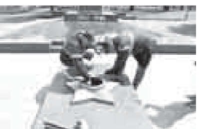
де кыралда «Махтаулыкуну ёмюрлюк оту» деген эсгертме - Терс-Кюлда орналады. КУРДАНЛАНЫ Сулейман.

«Газпром газораспределение Нальчик» компанияны келечилери Улуу Хорламаны байрамны «Священный долг. Вечная память» деген акцияны бардыргандыла. Аны чеклеринде Къабарты-Малкърда Улуу Ата журт урушда жоулганлагыз салынган эки жыйрмадан артык эсгертмени алларында ёмюрлюк от жанып турурча мадар этиленди, деп билдириледи компанияны пресс-службасындан. Быллай ишлени «Газпром» 2015 жылдан бери бардырады. Аны кезиюнде жер тобою била барган быргылыланы, техниканы эм оборудованины тинтедиле, тозурагытлары алышдыла, жалындан тазалайдыла. Эсге сала айтсакъ: Къабарты-Малкърда эсгертмелени кебосонне газ 1980 жылда тартылганды. Республикада кек от эм биринчи Прохладнада Эсгерюну скверинде жандырылганды. Бюгонлюк