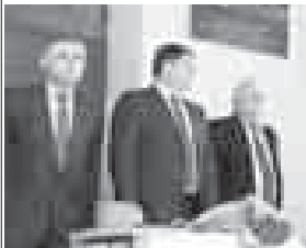
Эрттеннигден окууна омакъ кийинген жашла бла къызла торлю-торлю гоп къысымлары, шарлары, тасмалары бла да кёреге къычунуу кёрюне, кёнюнго да кёреге, от кюн улуу жашаугъа биринчи атламы байрамы болганыны эсгертенди.