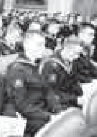
игилендирге, илму-билим берюу жагы бла проектини бирге бардыргъа белгиленди. - Аскер-тенгиз флотуну бла республикабыны араларында иши эмда шухъ байламлыкла