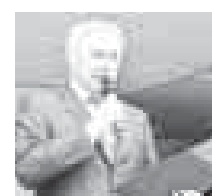
Андан ары ол демениги кыралыбызда кеп милеттени келечилери, кырандашчала, эгечпеча, жарышуукуда жашаганыларын, маданиятларын, адабиятларын да бир торлю чырамусуз айныта барганыларын чертип айтканды. Аланы араларында бизни Кыбарты-Малкырыбыз да тийишли жер да эсте салгандыла.