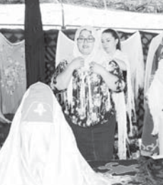
Элбрус району келечилери.

Жаулукъланы торлолери бла бек бай кюрюмч, балла, Курчаланы Семваланы Зекфираны эди. Гыранчаланы, мукорелени торло-торлопери, ботала, копелсе, кишмир жаулукъла, тийюлген чилле жаулукъла, чикилла, окъа токъмакълы