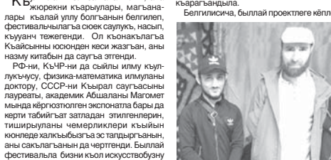
Белгилисича, быллай проектеге килпе

ла, тауу къыяла кийип, Шахалланы Фаризаны, Бостанланы Азаны, Хаджиланы Жамиланы, Шимал Кавказыны гунитаран академиясыны доктын кифедарлары тиширчу кийимле – жыйрыкъ, жаулукъ, башка баш кийим – коллекцияларына къаргандыла.