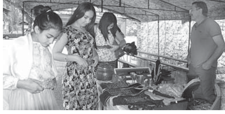
Курталаны Солтан керюмюче.

ла, тауу къыяла кийип, Шахалланы Фаризаны, Бостанланы Азаны, Хаджиланы Жамиланы, Шимал Кавказыны гунитаран академиясыны доктын кифедарлары тиширчу кийимле – жыйрыкъ, жаулукъ, башка баш кийим – коллекцияларына къаргандыла.