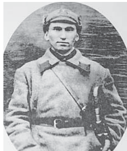
Муртазланы Сарбийни жашы Абулла.

Жылла уа бир бирлерин алышындыра бара эдиле. Ахлулары биргесине болшанларына къууанып, аланы ачитмаз ючюн Кариге бютюн къаты ишлерге тюшеди. Тютюн тахтадан арып-талып келгенден сора да, ол къошнулагы