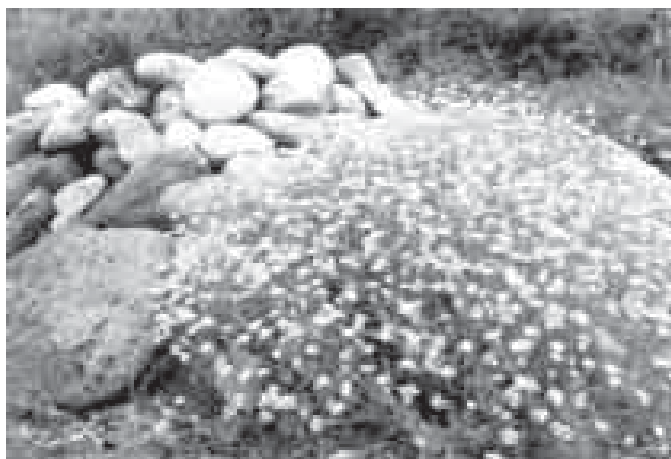
Ёмюрлюк бла биркюнлюк. Суратны ОСМАНЛАНЫ Хыйса алганды.