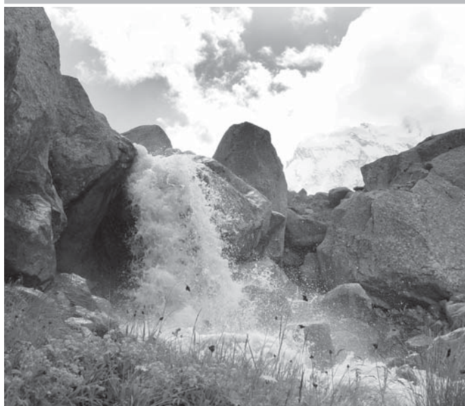
МАЗАЛЛЫ СУУ СЕКИРТМЕ.