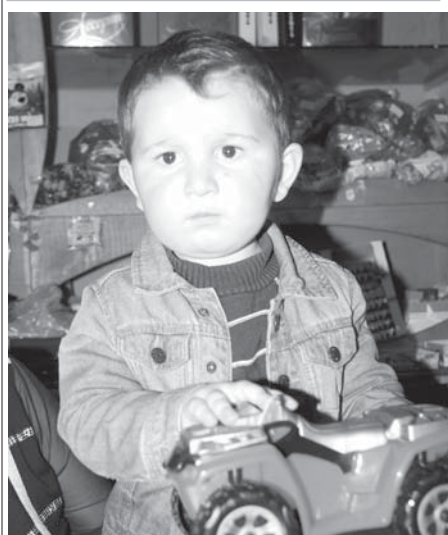
Чочайланы Азрет Бызынги элде жашайды. Анга жыл бла жарым болады. Ол машиначыкыла бла ойнаргы бек сюеди.