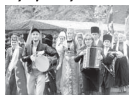
уанчына чакъырады, ашыгып сакълайды. Хош келигиз! Байрам 11:00 сагъатда башланырыкъды.

юсюнде барында оюнла, кьол таш атыу, скандырбек дегенча миллет эришуле, сабий оюнла, бурунгу Малкъарны тепсеулери бла жырлары кьошуладыла.