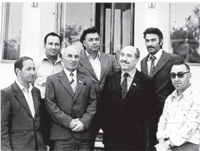
Алим къалам къарындашлары бла.