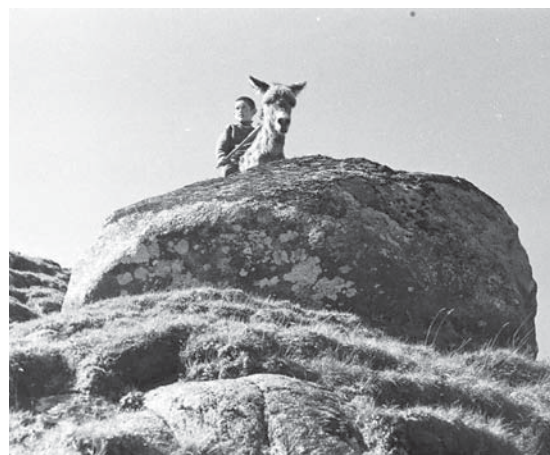
Шахмырзаланы Алексейни Огъары Малкъарда алынган сураты.

биринчиси уа «Кабардино-Балкарская правда» газетде 1960 жылда басмалангъанды.