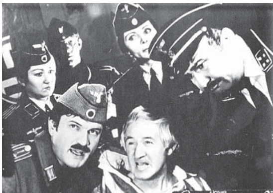
«Тюбеширбизми?» деген спектакльден.