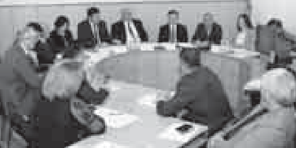
Тёрлёрлук мадарны айнтынуга энчи эс бурулады.

Жылны алпандан бир гитче эм орталыкъ бизнесни предприниматерлери 35 микросайт берилгенди, битуде да бирге 25,2 миллион сом. Ырысха бла болушур мурат бла уа бизнес-инкубаторла ишленгендиле.