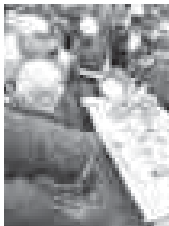
Жан сөөкни да белмегенди. Бусугатда уа аны эки этенде, башка жашуу сөөк тешики кыялак. Алгын тиштурулууга хант юлюш чыгарылмагындан. Арданан арты ол жорук да торленгенди.

маддан 6-10 юлюш чыгарылады. Алгын кёкюрк тёш, анга ноуана деп да айтадыла, ол санагыра кирмегенди. Айтылууда кёре, малланы жери алагы сапгъан кыянын, жайда, кышыда да аланы ызларындан айланганы ючюн эм талты жерин, кёкюрк тёшюн, кесине койгандын. «Тарап тара ашайды» деген нарт сөз да андан жартылгъан болур, баям.