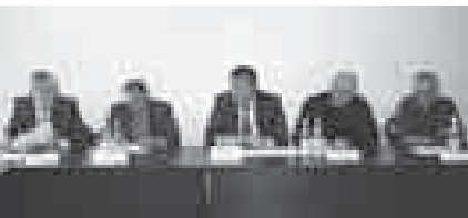
От туюшоуге кьажу мадарала жангьртылганлай турадыла.

тюрюю иш бардырылганды, пландан тышханда онбеш керэ тинтиу кьуралганды, законга бузукьлук этгенге 57 административе протокол жарашдырылганды, агьачны эркиликсиз хайырланган 22 адам ачыкьланганды, аладан 16-сы жарашдыруучу сьудге берилгенди, деп, министри орунбасары жыйылганына эспери агьачлага бек улуу халеклик Черк, Урван, Зольск, Май, Чегем муниципал районлада салынганларын бурганды.