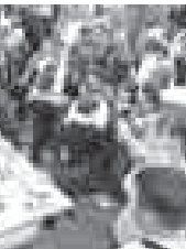
...Кыонокъалы атларындыла торшоират: «Хош келгиз, жууккъ болуугу!» — дейдиле, Башлыклары кыраал, алай намысты, Кёп жуурулу, орусан аяк бердиле...»

Койну кыкерегин бля кыарын жырганды, кемирчек чыгады. Аны сойгъан жерде кабыргыга жабышдырырга керекди. Ол мал халдыны деген магъананы тутуды. Хант колшоге кошокъуламын жети зат: бауру, бюирек, жорек, ёпке, бою аркыа, кыулсоюмек, акыла. Аша салынмаган жети зат: ёнгөш, ёт, жорек, кулак, талак, унтлык, беале,