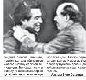
гъа ызалагъанды. Биогонлюде ол сагъаныз Къыргызыны бля уллу дунияны арасында тежи кельчакъ ушакълагъанды. Ахыры 3-чо бетдеди.

да миллетини ёхтемлиги болуп къалмай, битеудуния культураны бийиклеринде бек сайлы жери алады. Аны адабият чыгармачылыгы биз, малкъарлыла, бек уллу ырызлыкъ бля зотге тошюрген къыргыз халкыны сёзюм, сагъышын, жашау болууун, хунерлигин, тазалыгын, ачыкчылыгын да дуниягъа белгили этгенди. Ол чыгармачылыкъ жолун сайлай айланган жылла совет халкъыны адабиятлары терк айнып, къырау ала баргъан чакъгъа тош-