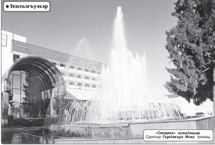
«Синдикс» хъэцӕщыр. Сурӕтыр Гукӕкӕуэ Инал триащ.