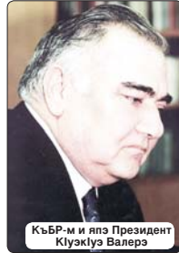
КъБР-м и япэ Президент Къуакъуэ Валерэ