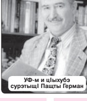
УФ-м и цIыхубэ суратыщI Пащты Герман