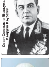
Совет Союзым и Лыжьуэ Къардан Къубагий