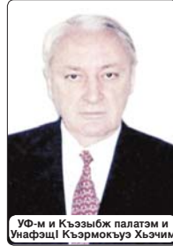
УФ-м и Къэзыбж палатэм и УнафшI Къэрмокъуэ Хъэчим