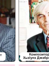
Композитор ХъэлIуэ Джэбрэил