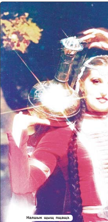
Налшык шыцхуэ пщэцхэ.