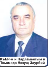
КъБР-м и Парламентым и тхъэмэдэ Нохуц Зэурбий