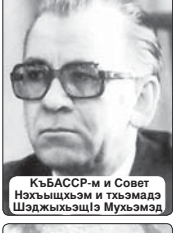
КъБАССР-м и Совет Нэхъышхъэм и тхъэмэдэ ШаджыхъэщIэ Мухъэмэдэ