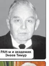
РАН-м и академик Энеев Тимур