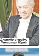
Дирижер цIарыуэ Темуркъан Юрий