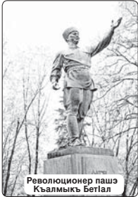
Революционер пашэ Къалмыкъ БетIал