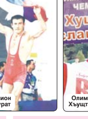
Олимп чемпион Хъуцт Аслъэнбэч