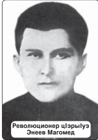
Революционер цIарыуэ Энеев Магомед