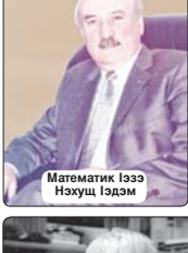
Математик Iзэ Нохуц Iэдэм