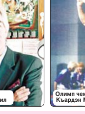
Олимп чемпион Къардан Мурат