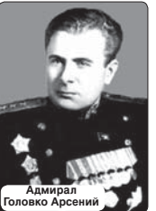
Адмирал Головки Арсени