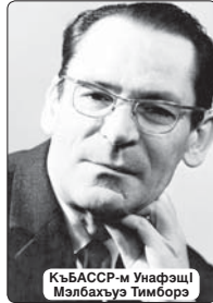
КъБАССР-м УнафшI Мэлбахъуэ Тимборэ