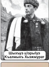
Шыхъуэ цIарыуэ Къалмыкъ Хъэжмурат