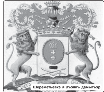
Шереметьевхэ я лъапхъэ дамыгъэр.

Урысеймр Къэбардеймр я тхыдам шызекуэ фыңшыгъэм гушхуынгыл къыгъызэщыгъэ шэ зыбжана ушырщэліл. Абым я шалъхъэ «Шереметьев» унафрщ. Лъапхъэ зымылауэжыгуыгуэм я шнахабэр зырыдэлэқам и шалъхъэ кымэ шыпылэ къышхьэу урысэбзэм хыпщэ хъуа я унафрщ. Урыс лъапхъыри и тхыдэ гыгуэнуагъэхим кыркукууэ, ар зуа кудейкыим, атэ шэн-къышхууэ лухухым хэ тащ, апщидожду тырку лъапхъыэм - пеленегым, половым, тэтэгъам, чувашым, башкирчым, къысэхъым къаыкхлжам унагуэ даукууэр къекылауақ. Арщ кызыкхлар фыңшыгъэр, нэхъ иужылуэкы унафрщлар кызуаңхуэр.