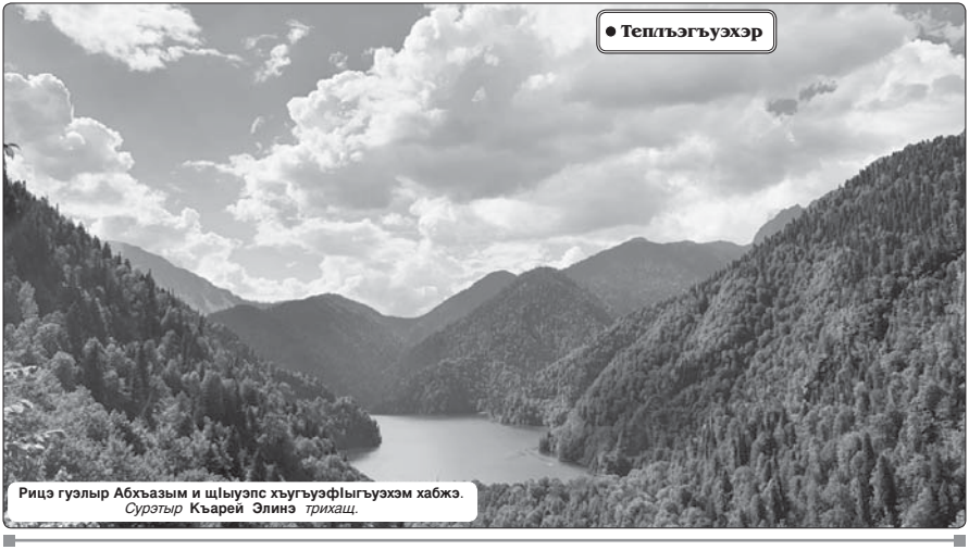
Рицэ гуэлыр Абхазыым и шчыуэлэ хугуэуэфыггүгүэхэм жабжэ. Суратэр Квэрей Элиэе трихцэ.