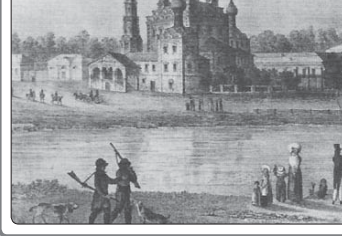
Останкино шыпылэм аты Шереметьевхэ я лъапсэр. XIX лашыгъуэ.

«Шеремет» унафрщ къысхъэ дьдэ зманри шьыпылары ярджарым. XVI дьды абы ушырхилэр Ялэ лашыгъыум епхэ дэстр-хорщ: Молжын и къуэ Шеремет (1551 гъ.). Хлудчев