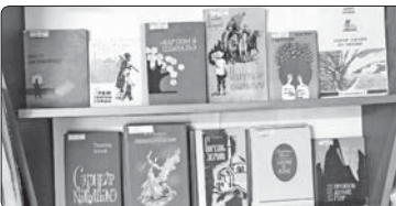
Тхылгэри суртэри ТЕКИУЖЭ Заретэ өши.