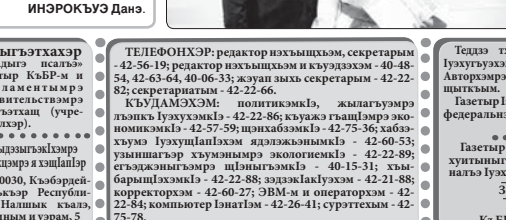
КьЭБЭРДЕЙ-Балькэрым и лыкьыцхэм зэхьэзэхуэ медаль зэмлэлуэжыгуэиц шкьыцхэм. Си хэлыгьыр килограмм 40-м нэблэгэхэм я элэццэщэцхэм.

Дмитров кьэалэм дэт мылэц уардунэм шеклуэц дэзюдокэм Урысейнэ и зэхьэзэхуэ. Абы и саугьэцхэм шлэбэщэц кьэралым и шлэныггэм 75-м кьыкьлэ, эи ныбкьыр ильэсэ 18-м ильэсэгэ ныбкьычэ 770-рэ.