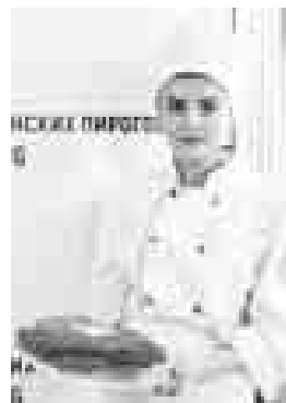
Северо-Кавказского аграрно-технологического колледжа в Осетии. Приятно было получить от него специальный подарок победителю – огромный кейс со столовым инвентарем». Следующий этап конкурса