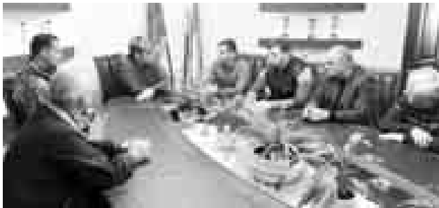
Врио Главы КБР Казбек КОКОВ выехал в муниципальные образования республики, наиболее пострадавшие 13 апреля от дождя и града. Основной

удар стихии пришелся на г.о. Баксан, Баксанский и Зольский районы.